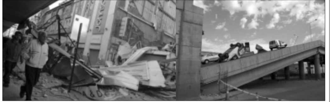
சாண்டியாகோ: சிலியின் கடலோரப் பகுதியில் திங்கட்கிழமை இரவு நில அதிர்ச்சி ஏற்பட்டது. இதன் அளவு 6.7 ரிக்டர் என்று அறிவிக்கப்பட்டுள்ளது. இதனால் ஏற்பட்ட உயிரிழப்பு மற்றும் சேதாரம் குறித்து தகவல் எதுவும் கிடைக்கவில்லை. பசிபிக் கடலில் 21.7 மைல் ஆழத்தில் இந்த நில அதிர்ச்சி ஏற்பட்டது. இது சுனாமியாக உருவாகாது என்று அமெரிக்க நிலவியல் நிபுணர்கள் தெரிவித்தனர். கடந்த பிப்ரவரி 27ந்தேதி ஏற்பட்ட நில அதிர்ச்சியில் 500க்கும் மேற்பட்டவர்கள் உயிரிழந்தனர். 3000 கோடி டாலர் மதிப்புள்ள சொத்துகள் சேதமடைந்தன என்பது குறிப்பிடத்தக்கது.